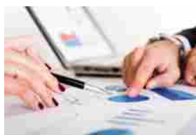
SERVIZI FINANZIARI AIM (0,0%) – IN VETTA 4AIM SICAF (+6,9%) E