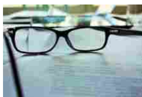
WM CAPITAL (AIM) – MANDATO DALLA CINESE NANJING PER LA