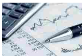
AIM (+1,1%) – TRAWELL CO (+18,2%) E GEL (+15%) IN